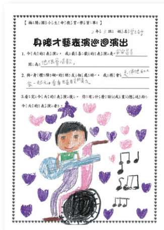
楠陽國小學童觀後心得（一）