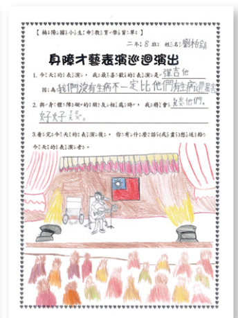
楠陽國小學童觀後心得（二）