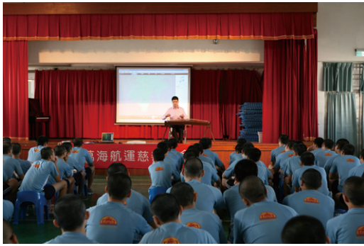
基金會偕同愛有為身障才藝大賽得主至新竹誠正中學舉辦關懷音樂會。