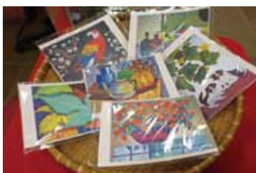
孩子手繪作品明信片