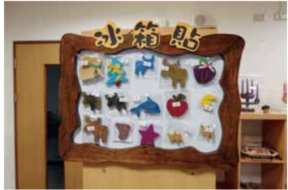
各式各樣的冰箱貼

十八歲以後學習一技之長的地方，在參觀愛心商店之前，院方先帶我們去教學的教室參觀，有學習木工的、繪畫的。有位孩子一看到我們，就一邊很害羞一邊把放在書包裡的畫作給我們看，好可愛。教室周圍也都有孩子們的作品，那精緻的設計，可是他們每天絞盡腦汁一點一滴畫出來的呢！