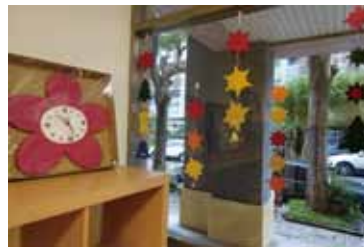
葉子形狀的木頭吊飾