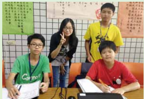
暑假成果展作品實作分組討論。

蘇教授說：「我和所有人一樣原本只想去看，沾個醬油，但後來我才知道，台灣像這樣的地方沒有一百個也有五十個。這樣小的教會，只有兩間兩層樓的平房，上面鐵皮屋加蓋，小小場地就擠70人，這才是東石港1/3的小朋友。」或許有些人會擔心這樣的課程對這裡的孩子來說太難，但出乎意料的，孩子們非常認真，從第一天第一堂課開始，沒有一位孩子放棄過。蘇教授希望他們往後至少能用這門技術找到謀生的路，即使未來沒有經費升學，也可以在社會上有立足點。