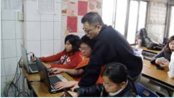
2015年寒假在嘉義東石鄉。