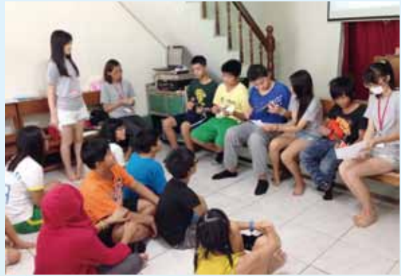
音樂組烏克蘭麗麗成果展。

說：「是我們把他們想的狀況太差了，其實學校的活動不少，我們詢問他們做過肥皂或其他手工藝嗎？孩子們大多會說做過了。」或許，都市孩子的父母已經幫他們安排好各式各樣的才藝了，但偏鄉的孩子則必須藉由學校安排，才有機會接觸學習。不過陳恩力也說到：「欣喜的是，最後一兩天，有位班上烏克蘭麗麗程度還不錯的小孩說，這麼多營隊我最喜歡你們。」