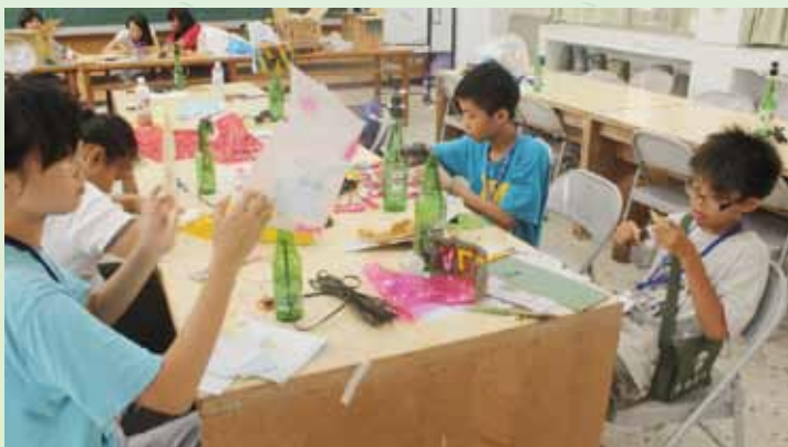
工藝組的酒瓶電燈。