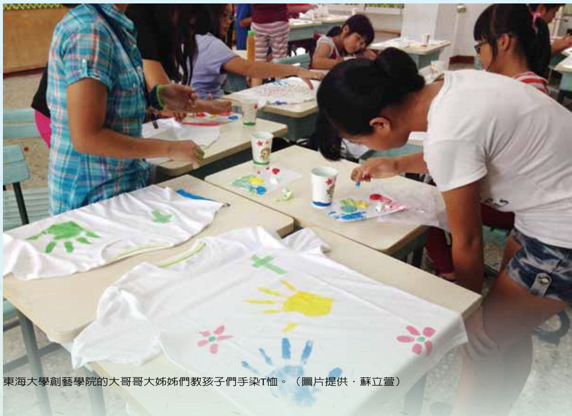
東海大學創藝學院的大哥哥大姊姊們教孩子們手染T恤。

「我沒有很偉大，其實也從中得到了樂趣。這裡有二、三十個小孩陪我玩，我生活很充實，這比什麼都有價值。孩子是這樣的，只要跟他有感情就會死忠，我只要讓他們安心，阿伯只要活著都會去，會一直和他們在一起，他們需要就是這個。」說著說著，鐵漢又流露出溫暖的一面了。