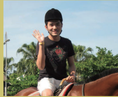
作者為律宇國際商務法律事務所執業律師

仍然拒絕酒測，員警將逕行認定為拒絕接受酒測，依道路交通管理處罰條例第35條第3項規定，得處六萬元罰鍰、當場移置保管車輛及吊銷駕照等處置。如果駕駛拒絕酒測，但只要有嘔吐、意識不清等情形，警方仍可能認定駕駛有「不能安全駕駛」之情事，將依刑法第185條之3規定移送法辦。