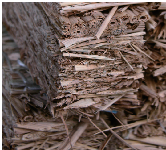
稻草 製作榻榻米的材料之一